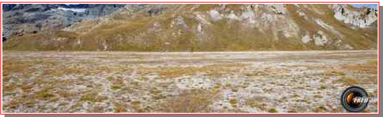
Le Plan Séry.