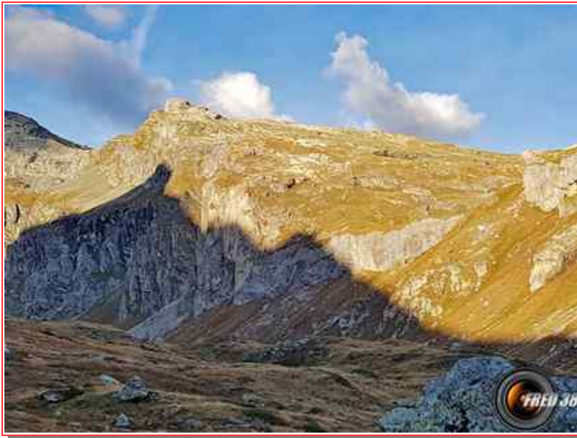
Le sommet vu du refuge de Plaisance.