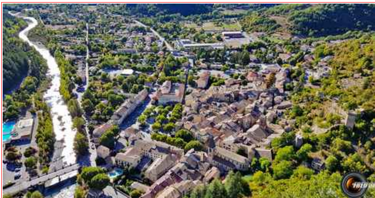
Castellane vu du sommet.

Itinéraire 3 km pour environ 160 m de dénivelé.