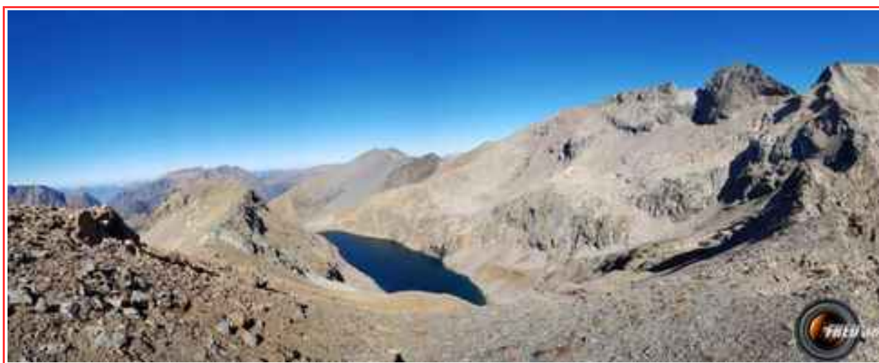
Lac du Vallon vu du sommet.

— Itinéraire 13 km (A/R), 1475 m de dénivelé.