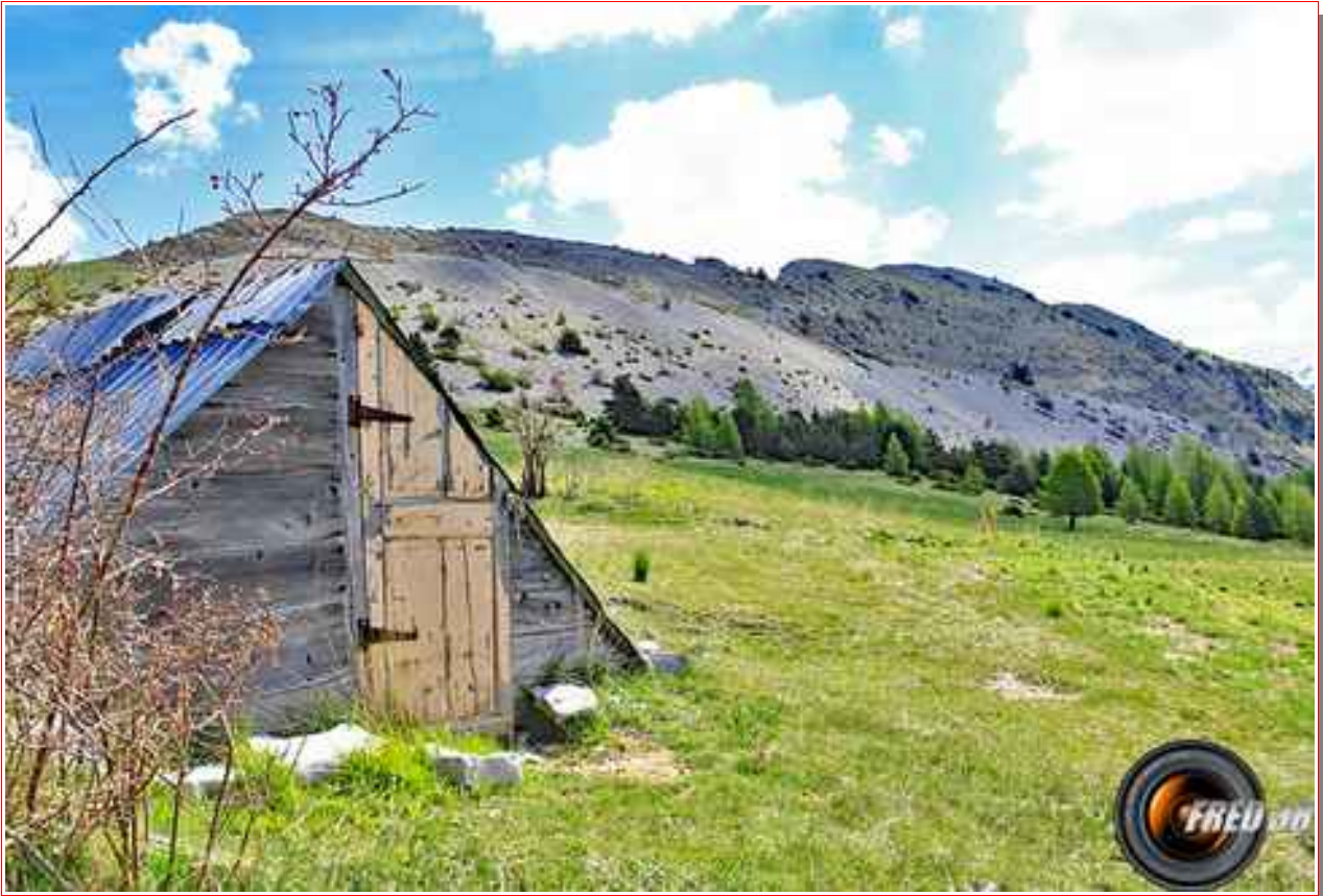
Le sommet vu de la bergerie

MASSIF : Pré-Alpes de Haute Provence CARTE: iGN 3440 ET