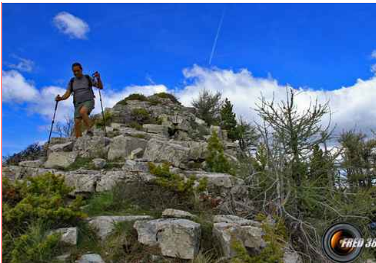
La crête avant d'arriver au Mourre Gros.