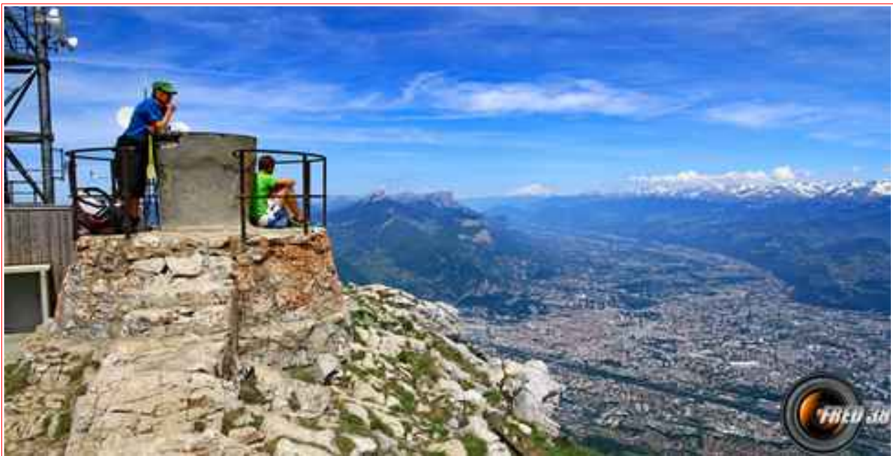
Grenoble, et la table d'orientation du sommet.