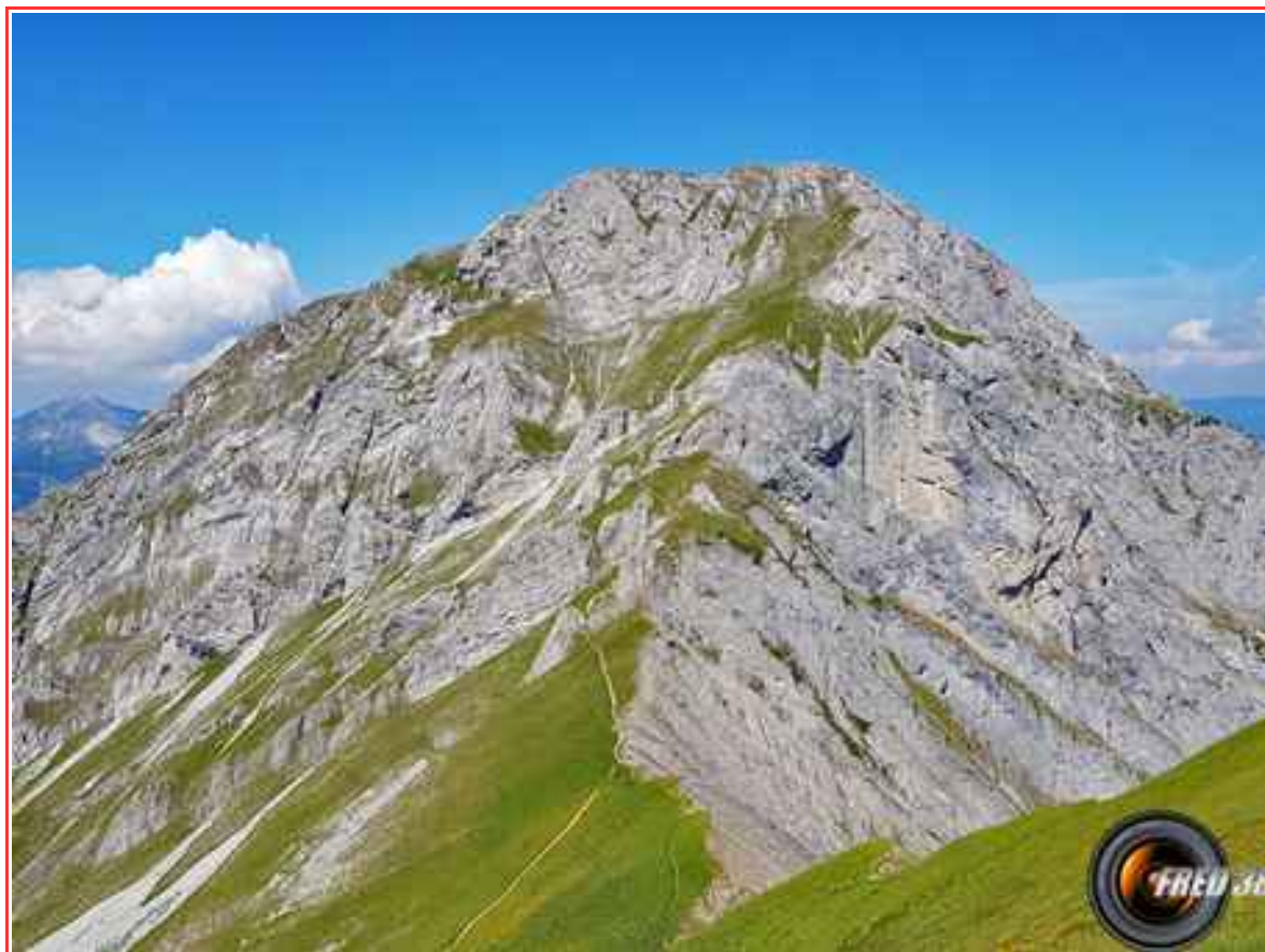
Le Mont Pécloz vu d'Arménaz.