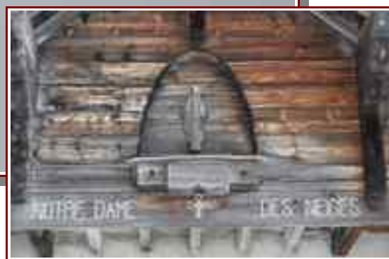
La vierge au dessus de l'entrée de la Chapelle