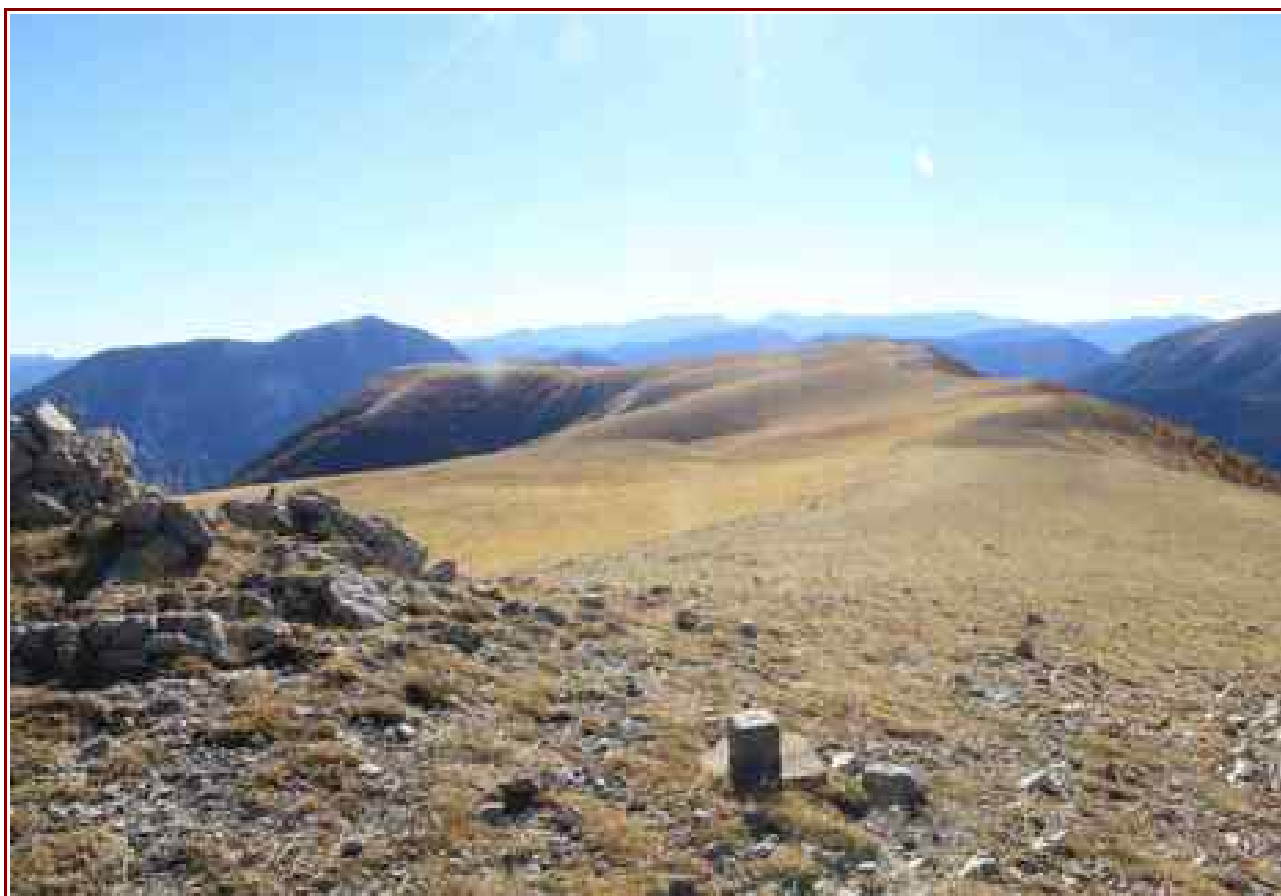
La large crête de la Montagne de Chamatte en direction des Serres