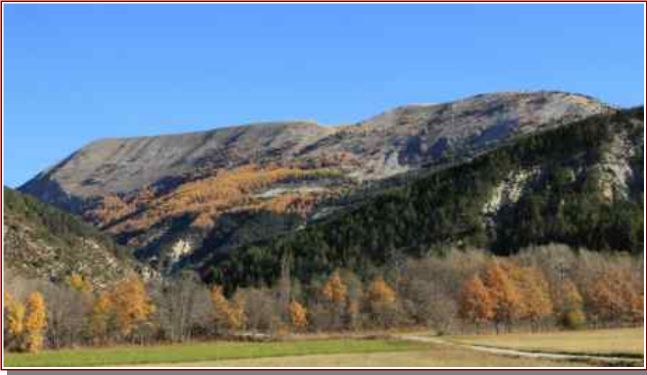
La crête vue de Thorame Basse.

MASSIF : Pré-Alpes de Haute Provence CARTE : IGN 3440 ET