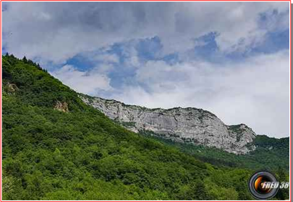
Les crêtes vues de Chavoire.