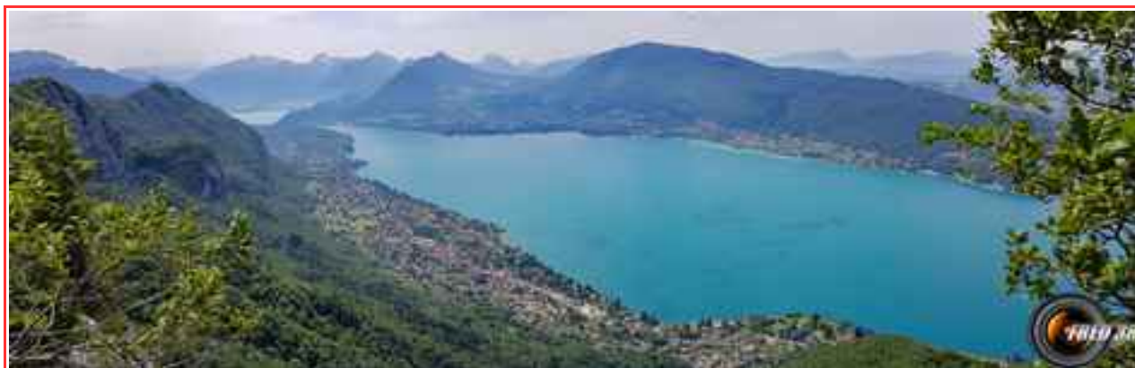
Le lac d'Annecy vu du col des Sauts.

Itinéraire pour le sommet 11 km, 1100 m de dénivelé positif.