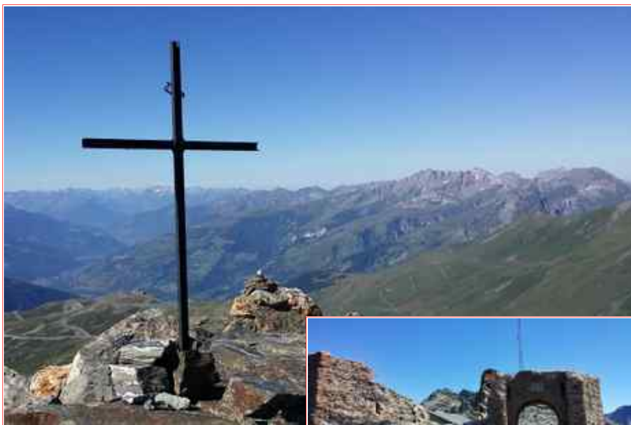
La croix du sommet et l'ancien fort au col.