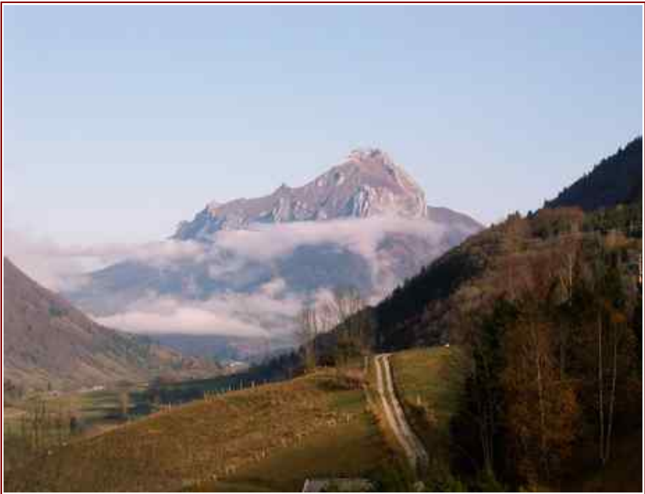
Le Trélod vu du col du Frêne