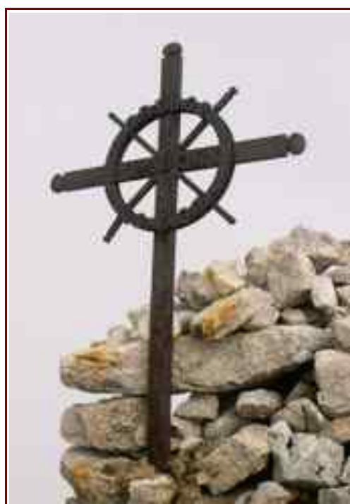
Photo du sommet

— Itinéraire de montée 4,6 km, 1111 m de dénivelé positif.