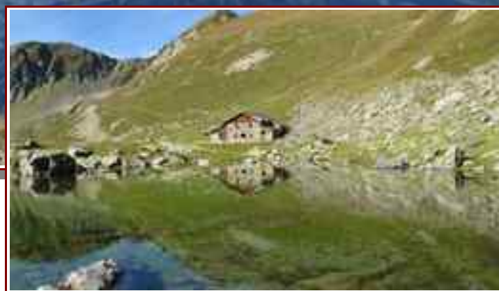
Le chalet du lac