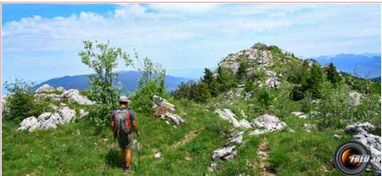
La crête finale.