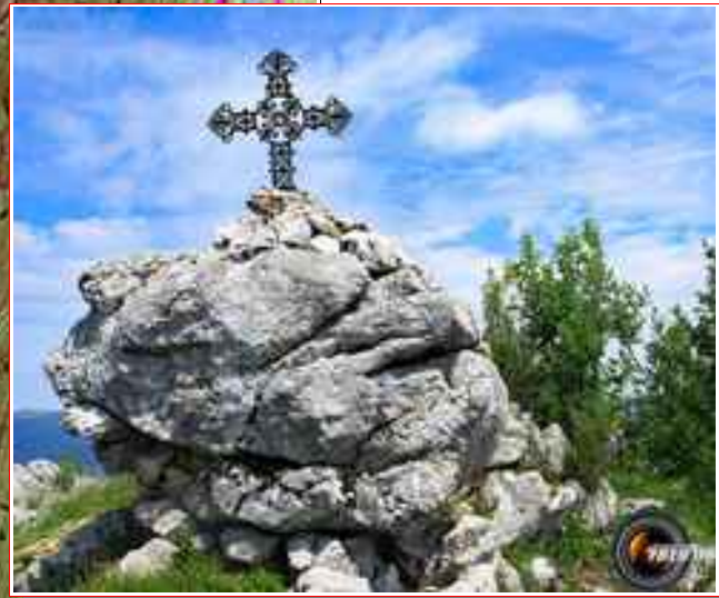
La croix du sommet.