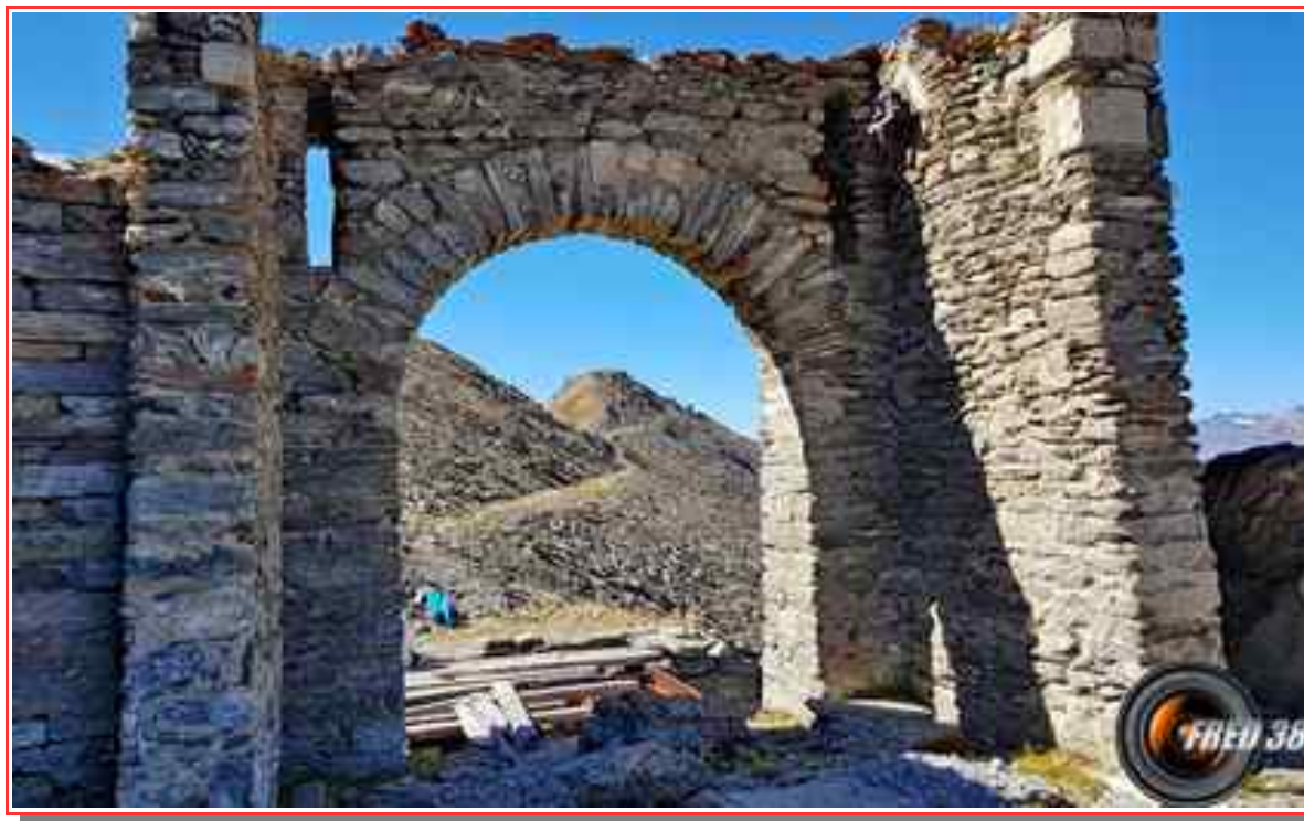
Le sommet sous l'arche.