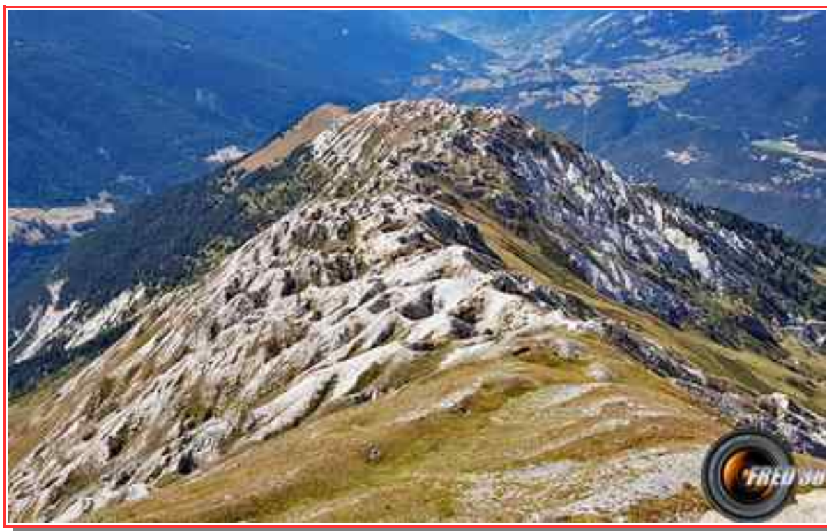
Les crêtes du Général Sasset.

Itinéraire boucle 13 km, 1260 m de dénivelé.