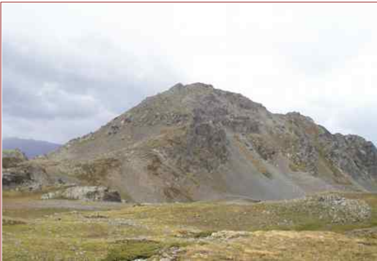
Le Chenaillet vu de la cabane des Douaniers