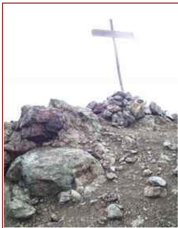
Le sommet du Chenaillet

Itinéraire pour le sommet 11 km, 912 m de dénivelé positif.