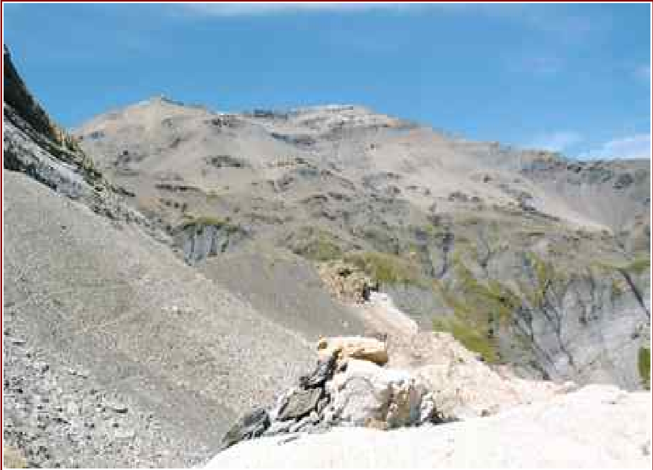
Le sommet vu du col de Salenton