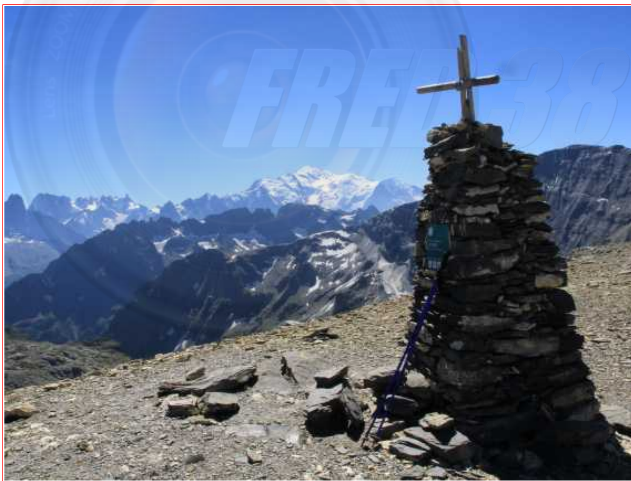
Le cairn du sommet et en fond le Mont Blanc.

— Distance 6,2 km, dénivelé positif 950 m.