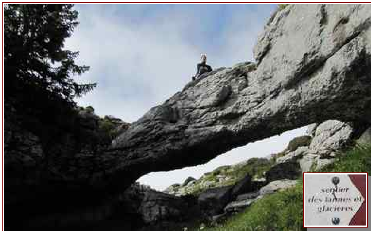
Pont naturel sur le sentier des Tannes