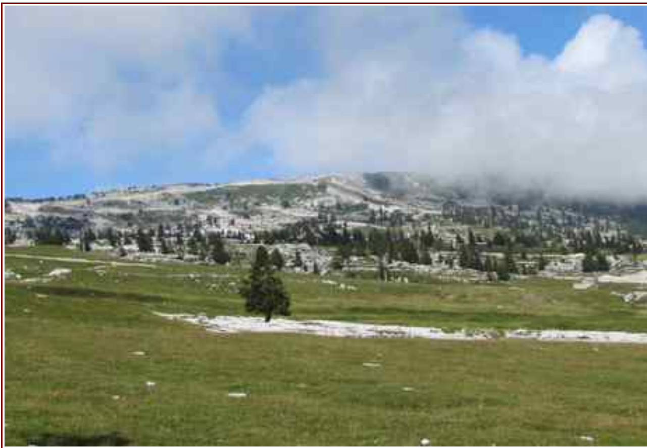
La crête sommitale vue des pistes de ski