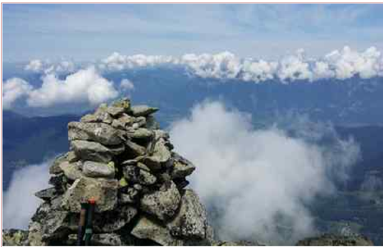
Le cairn du sommet