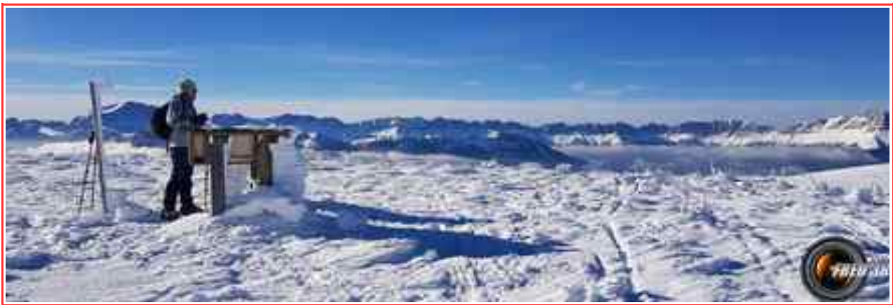
La table d'orientation du sommet.