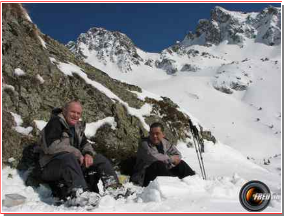
Près du lac principal.