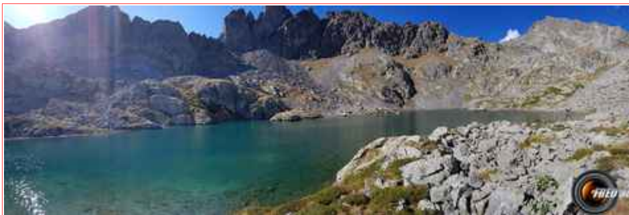
Le lac supérieur et à droite la Roche de l'Abisse.