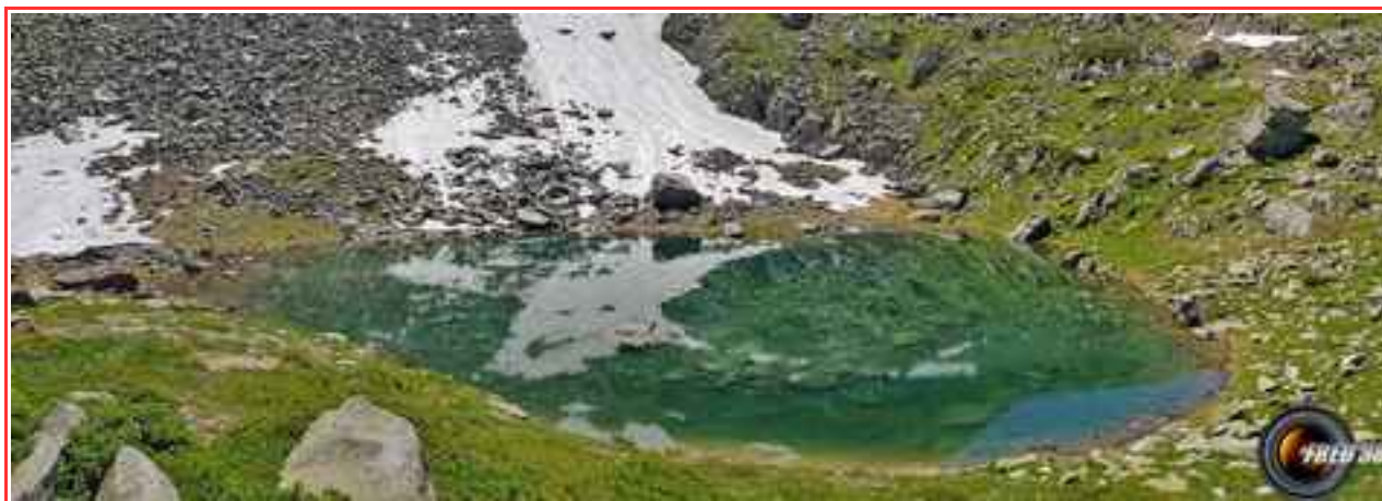
Le deuxième lac..

Itinéraire 1370 m dénivelé, longueur 11 km