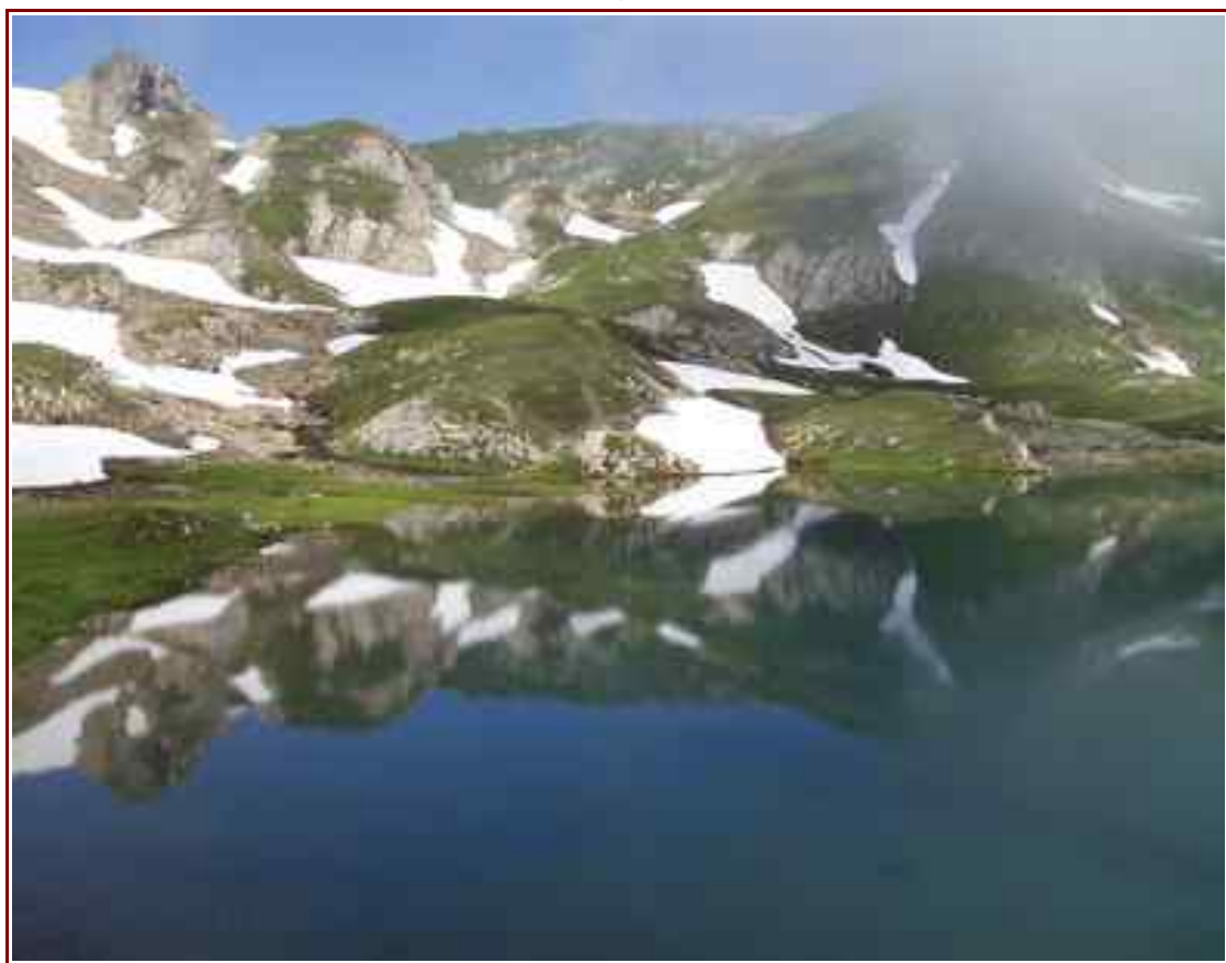
Le lac Noir

— Itinéraire de montée 5 km et 674 m de dénivelé positif.col de la vova — Variante 1,2 km et 325 m de dénivelé positif.