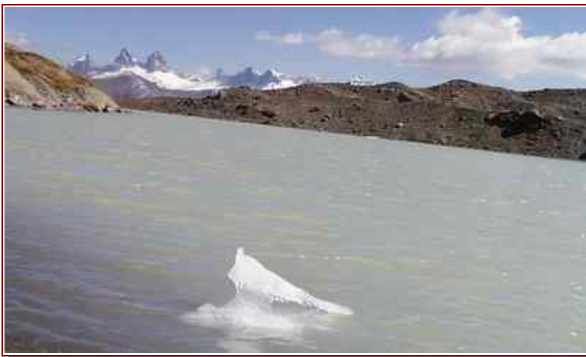
Le lac et en fond les aiguilles d'Arves

Itinéraire pour le sommet 6,3 km pour 987 m de dénivelé positif.