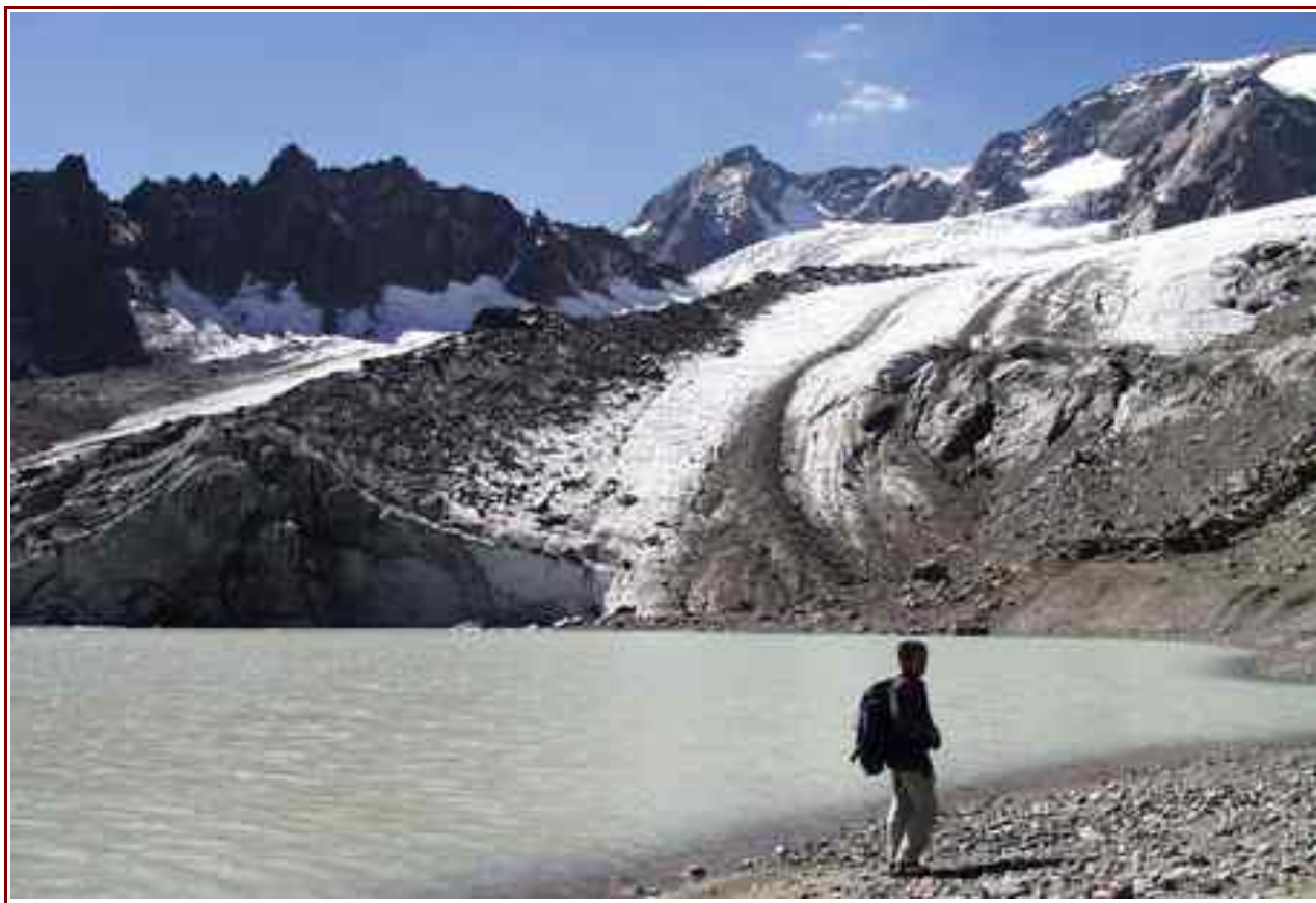
Glacier et lac des Quirliés