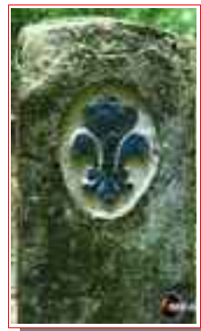
L'un des fours et la borne frontière Dauphiné/Savoie n° 422.