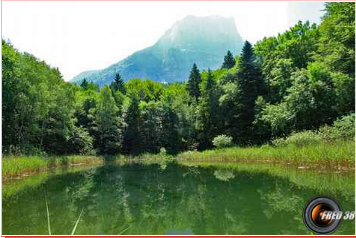
Le lac et en fond le Mont Granier