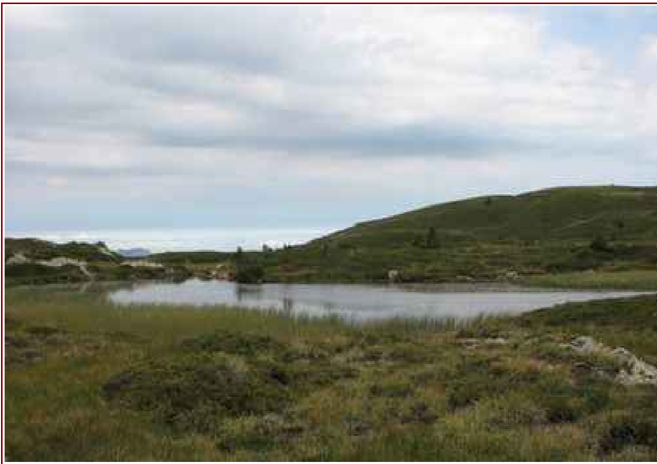
Le lac Fourchu