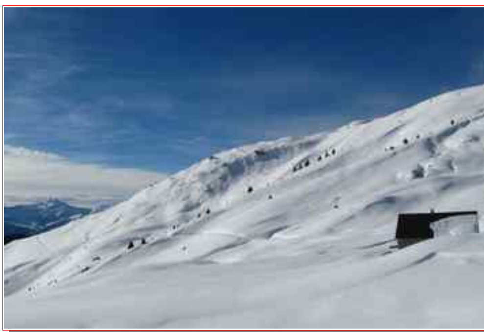
Le chalet du Plan du Jeu ® près du lac.