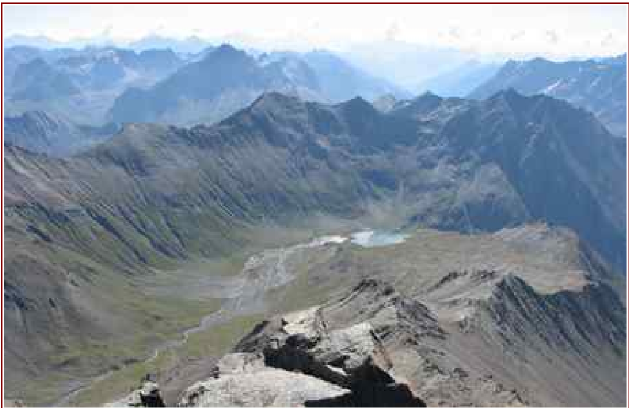
Le lac vu du sommet de l'Aiguille du Goléon