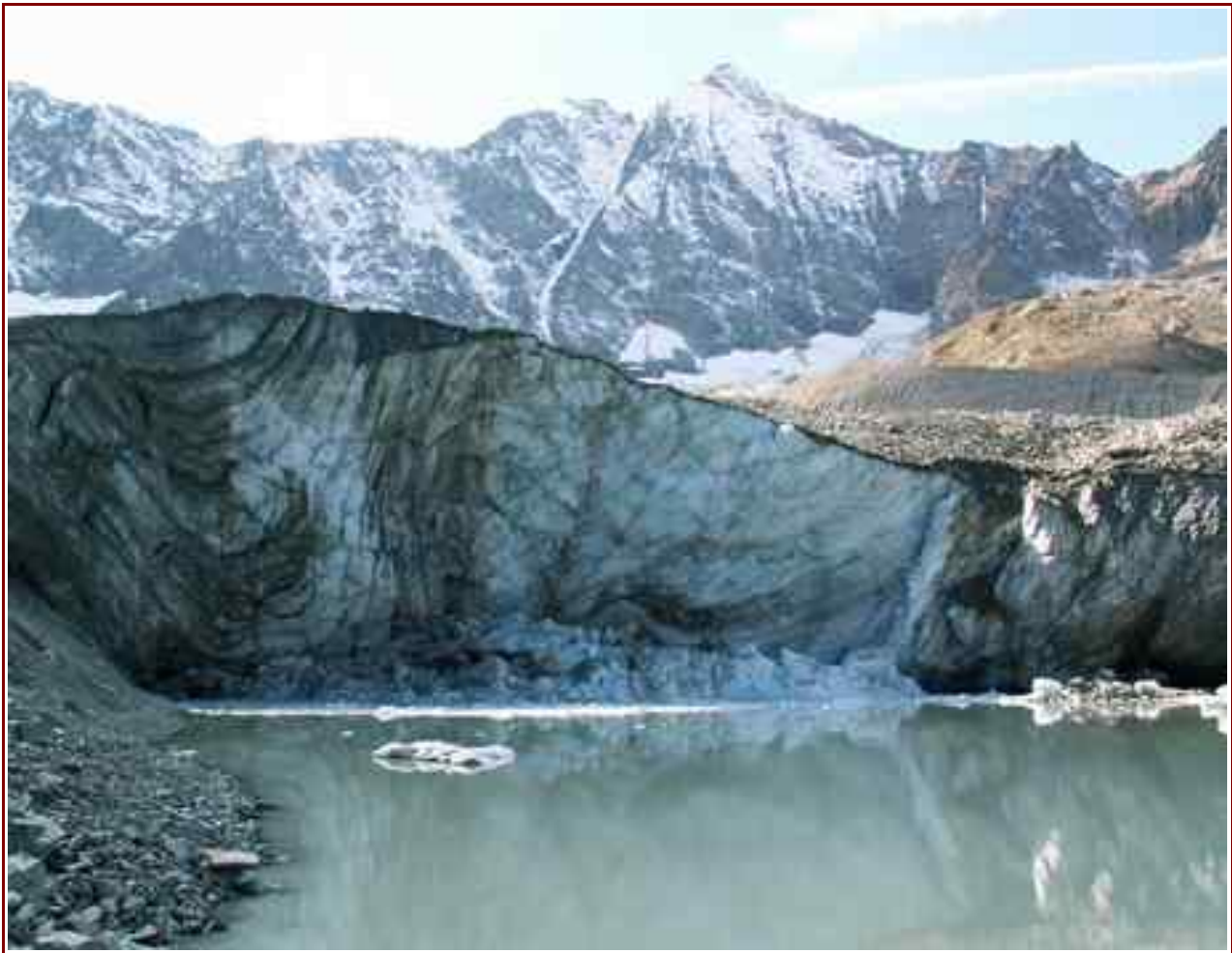
Le lac et son glacier en 2005