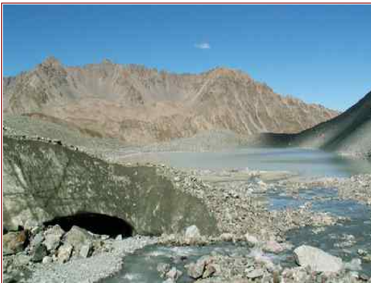
Lac vu de dessus