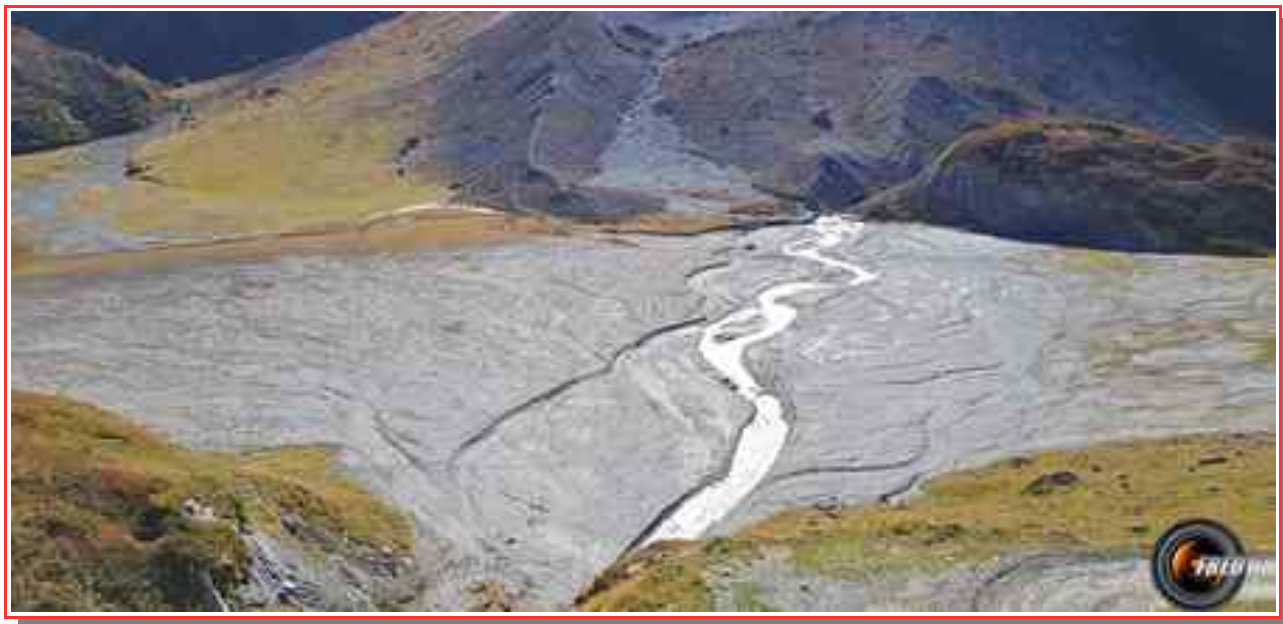
Le grand plan du lac de la Glière.