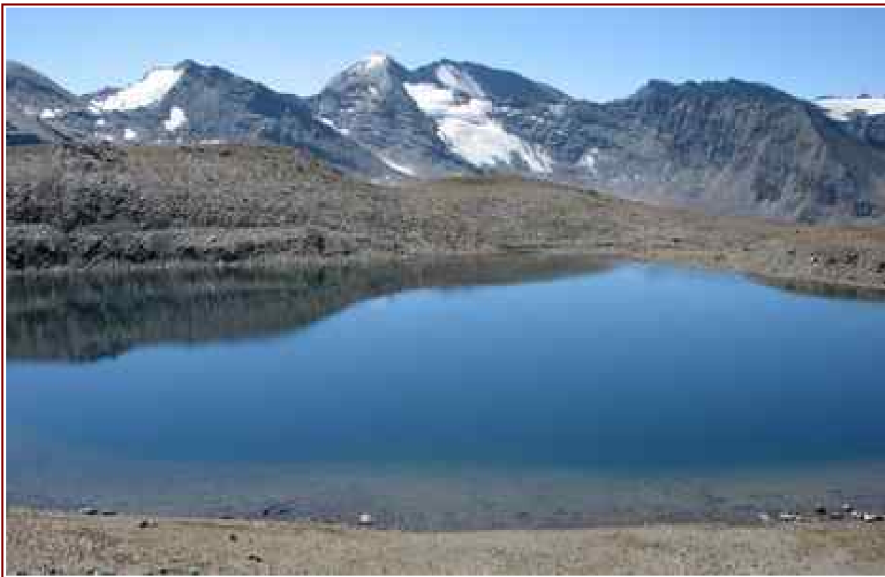
Le lac et en fond l'Albaron