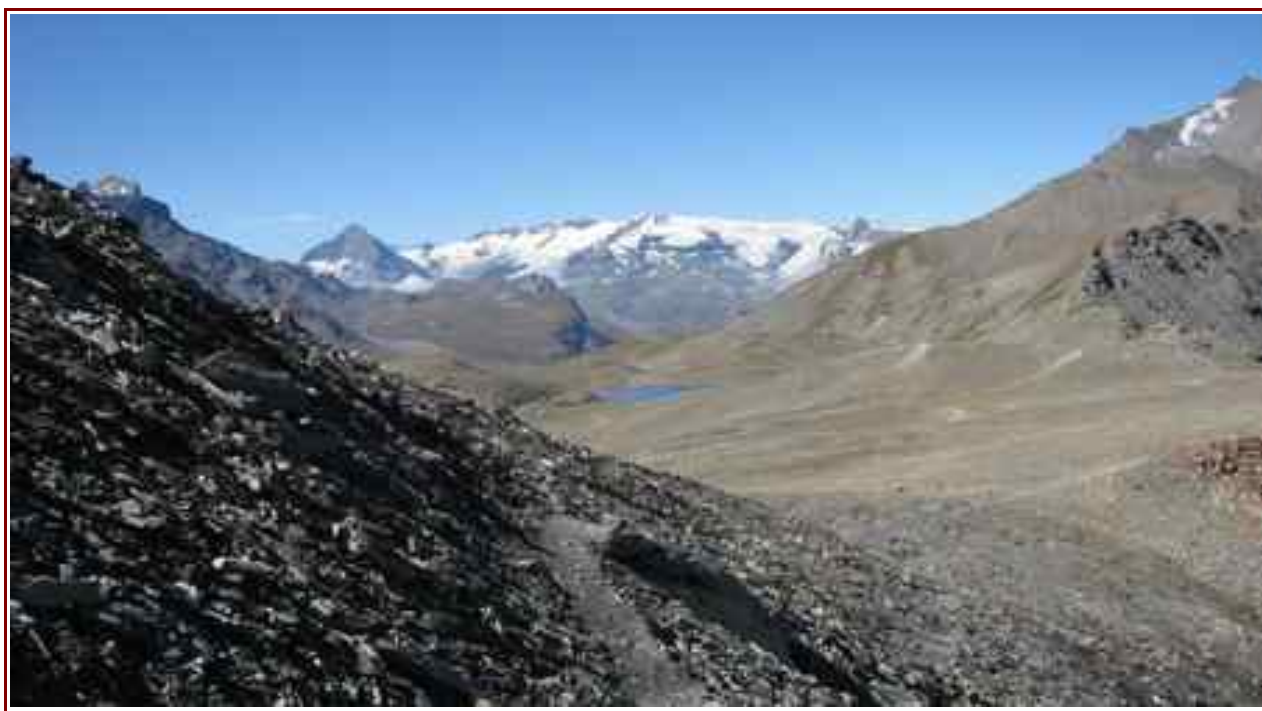
En fond le dôme de Chasseforet