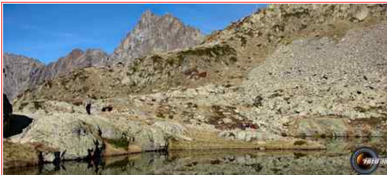
Le lac Lautier à 2363 m

Itinéraire pour le sommet 8,9 km, 1991 m de dénivelé positif.