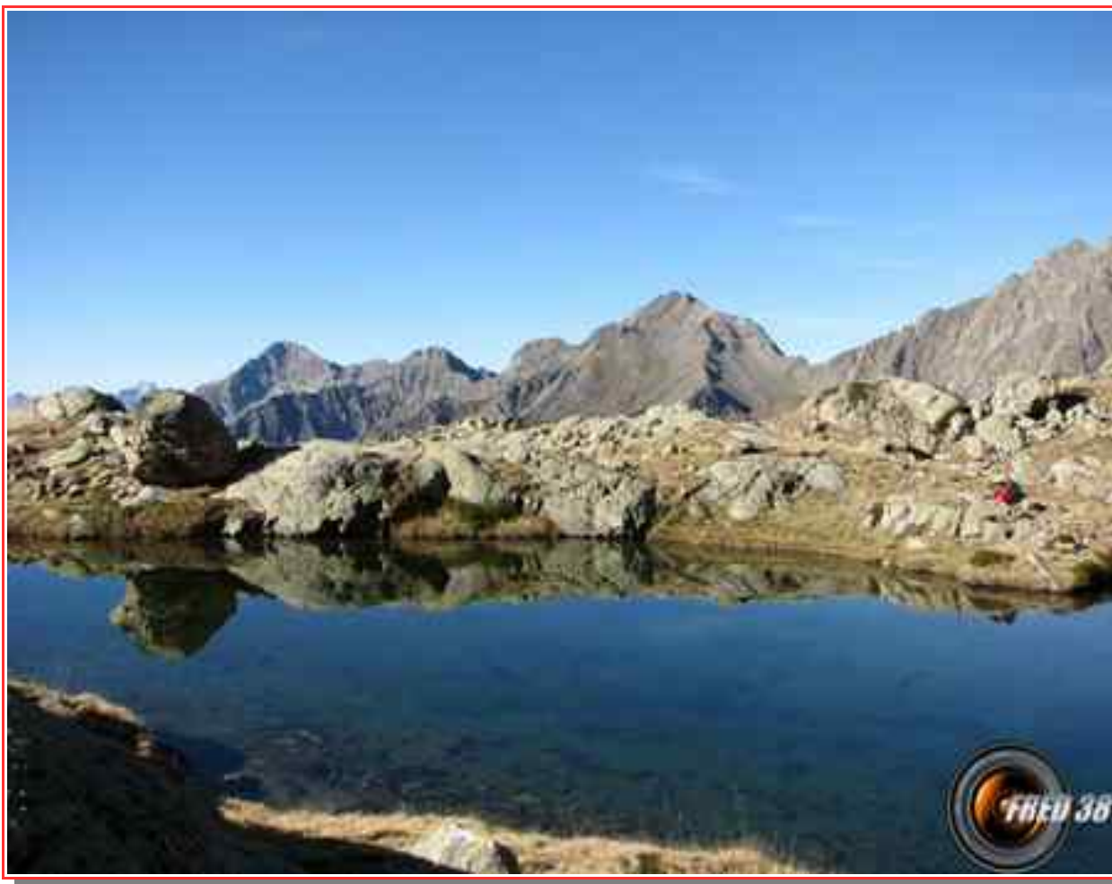
Le lac Autier,