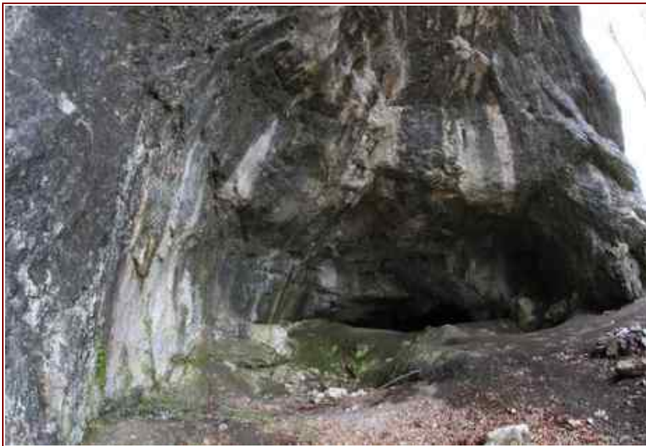
La grande entrée