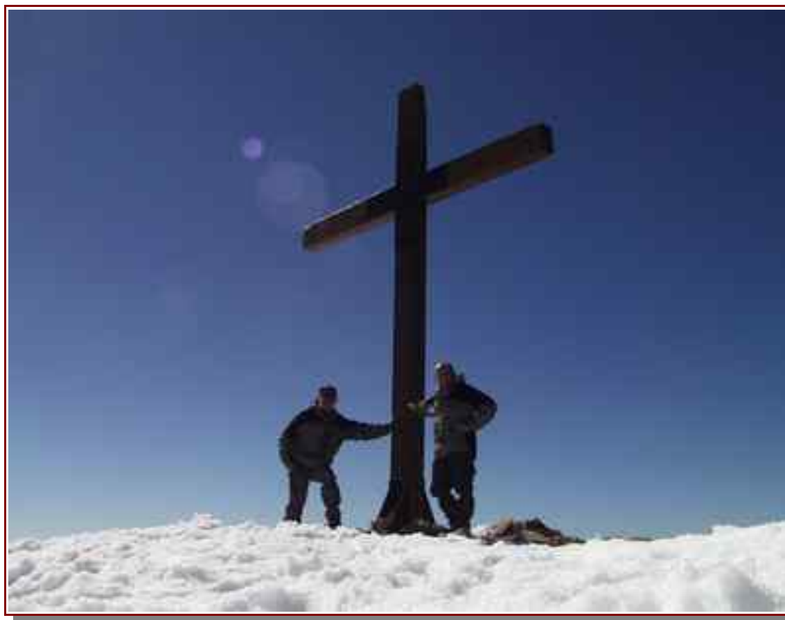
La croix du sommet