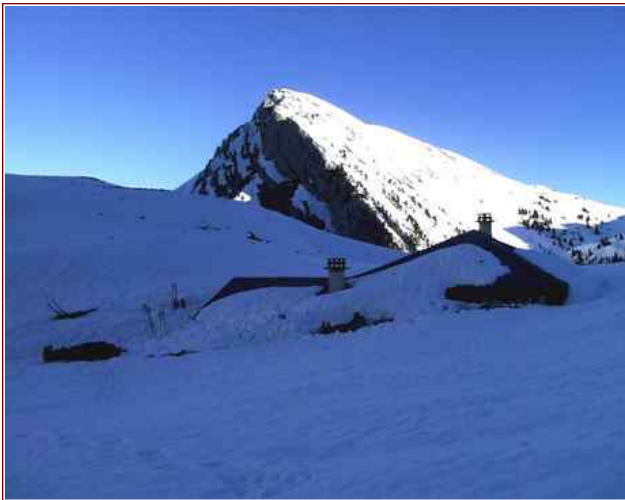
Le sommet, vu du habert d' Hurtière