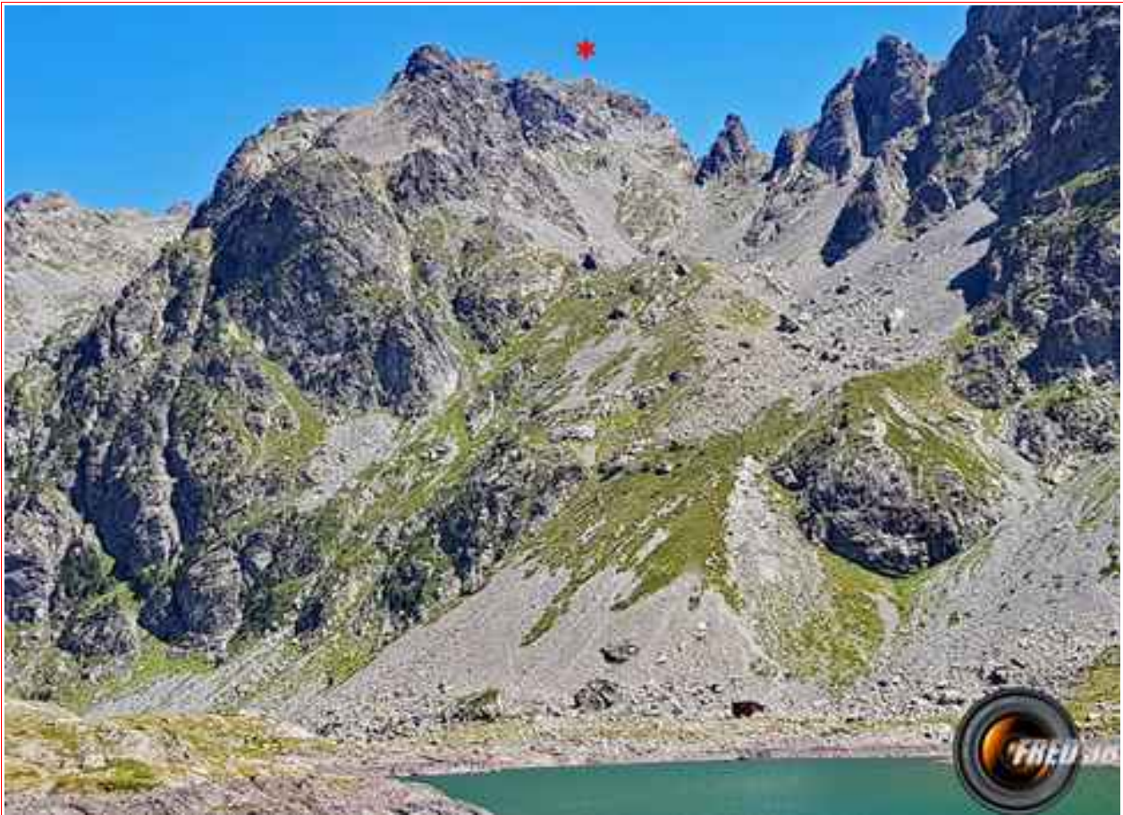
Le sommet vu des lacs Robert