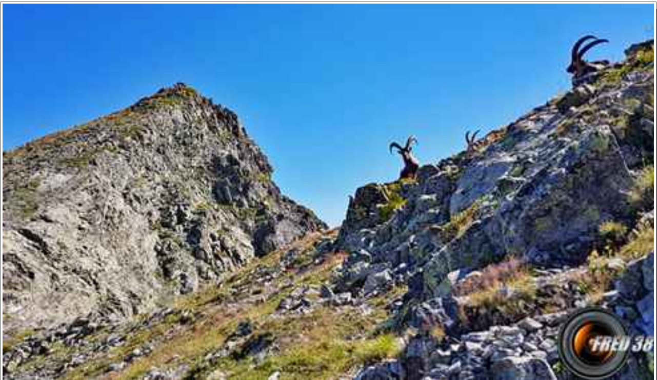
Le sommet et ses habitants.