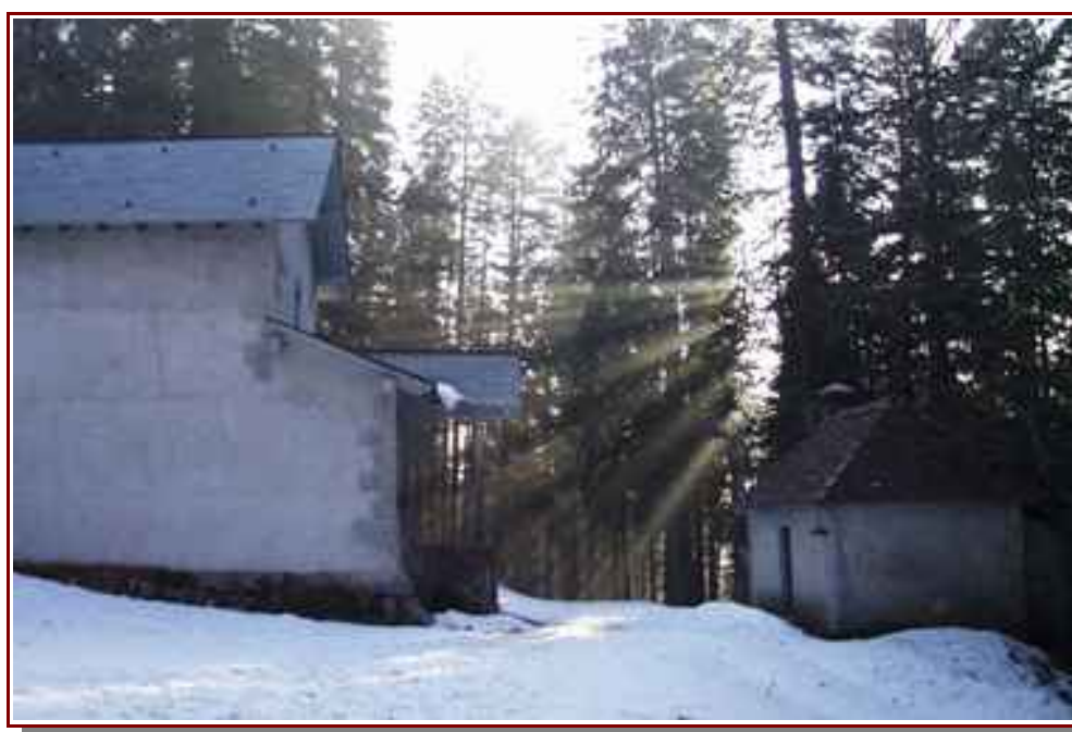
Notre Dame de Casalibus.

— Environ 8,5 km d'itinéraire, pour 1312 m de dénivelé positif et 145 m de dénivelé négatif.