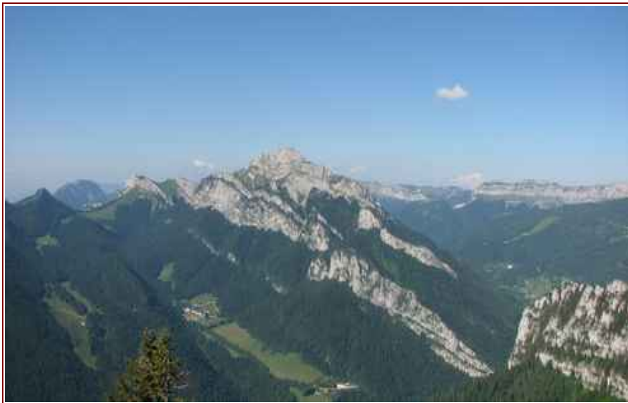
Sommet vu du Charmant Som