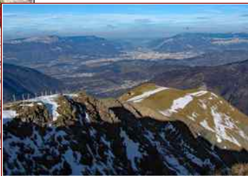
Les lacs de Laffrey Grenoble vu du sommet