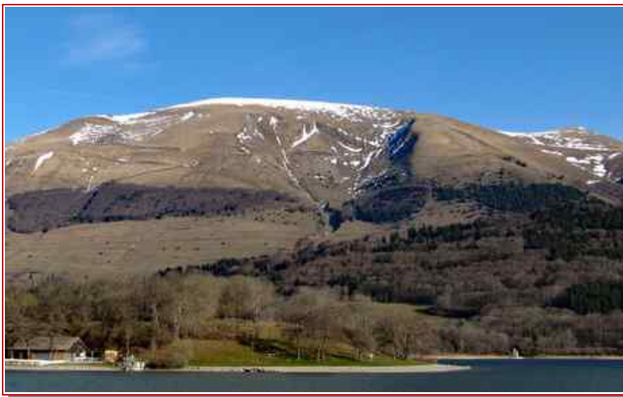
Le sommet vu du lac de Laffrey