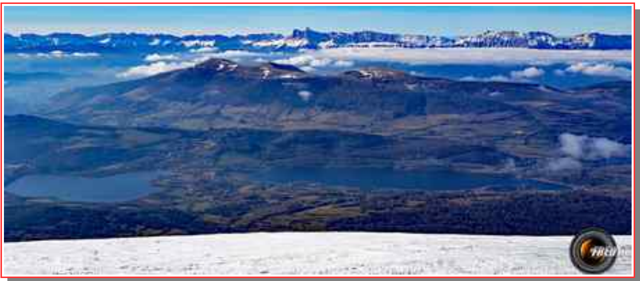
Vue sur le Vercors et les lacs de Laffrey.

Itinéraire 14,5 (a/r) km dénivelé 1050 m.