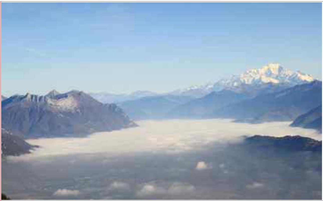
Du sommet, vue sur la Dent d'Arclusaz et le Mont-Blanc.