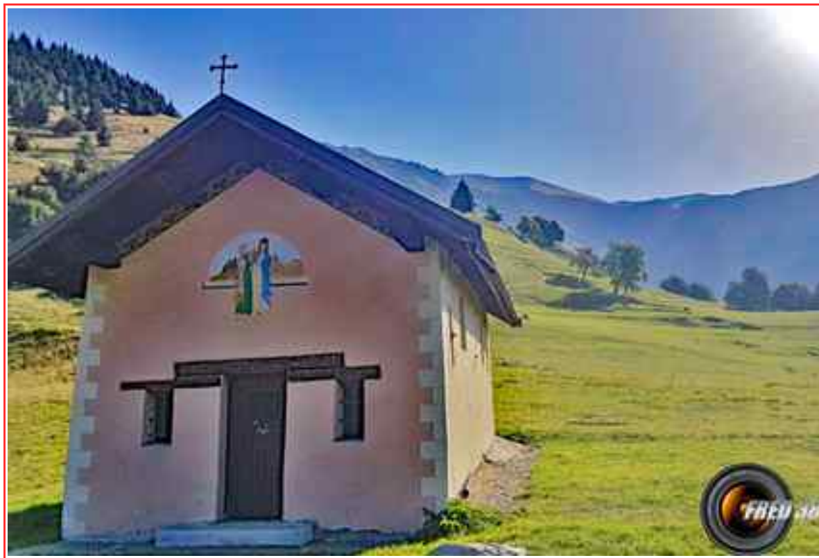
Le Sommet à droite de Notre-Dame du Chaussy.