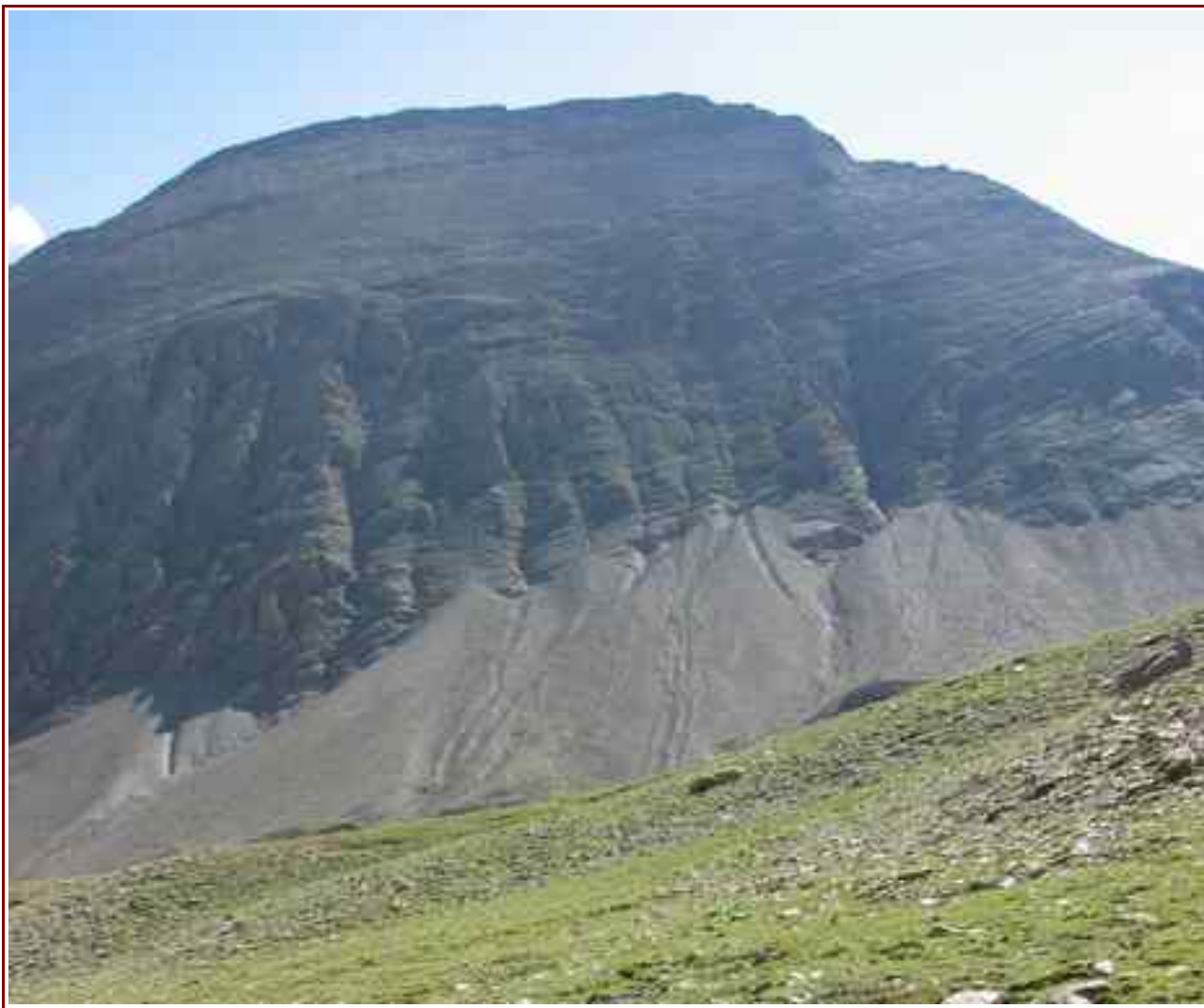
Le sommet vu du vallon du petit Parpaillon