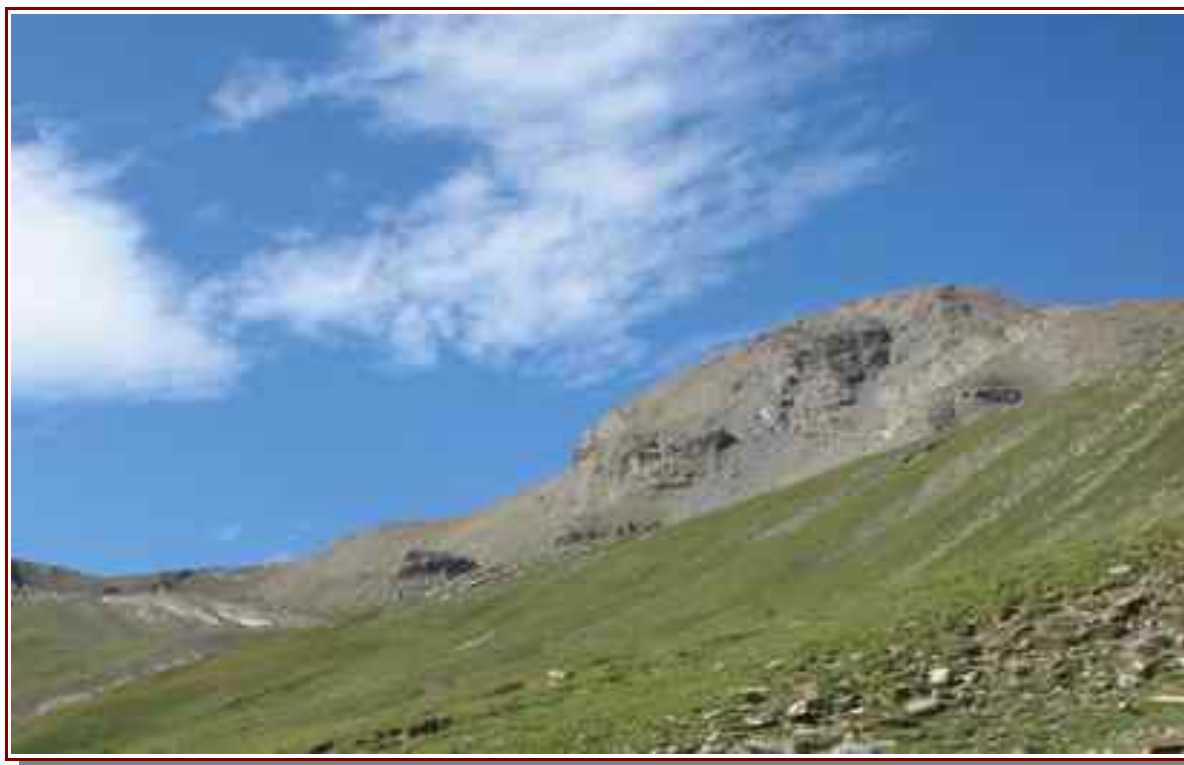
Le sommet à droite et le pas du Reverdillon à gauche