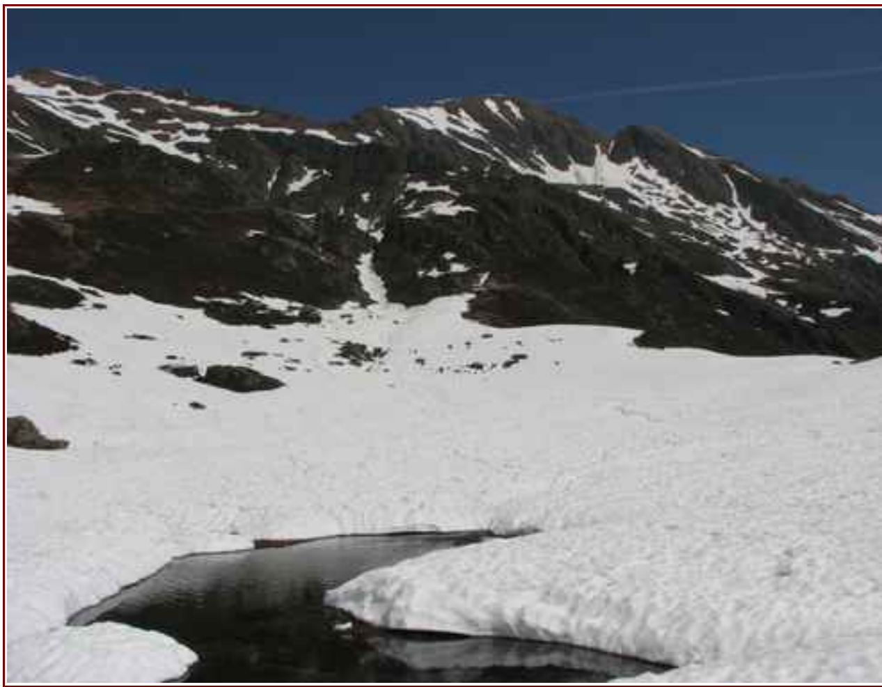
Le sommet vu du lac Noir