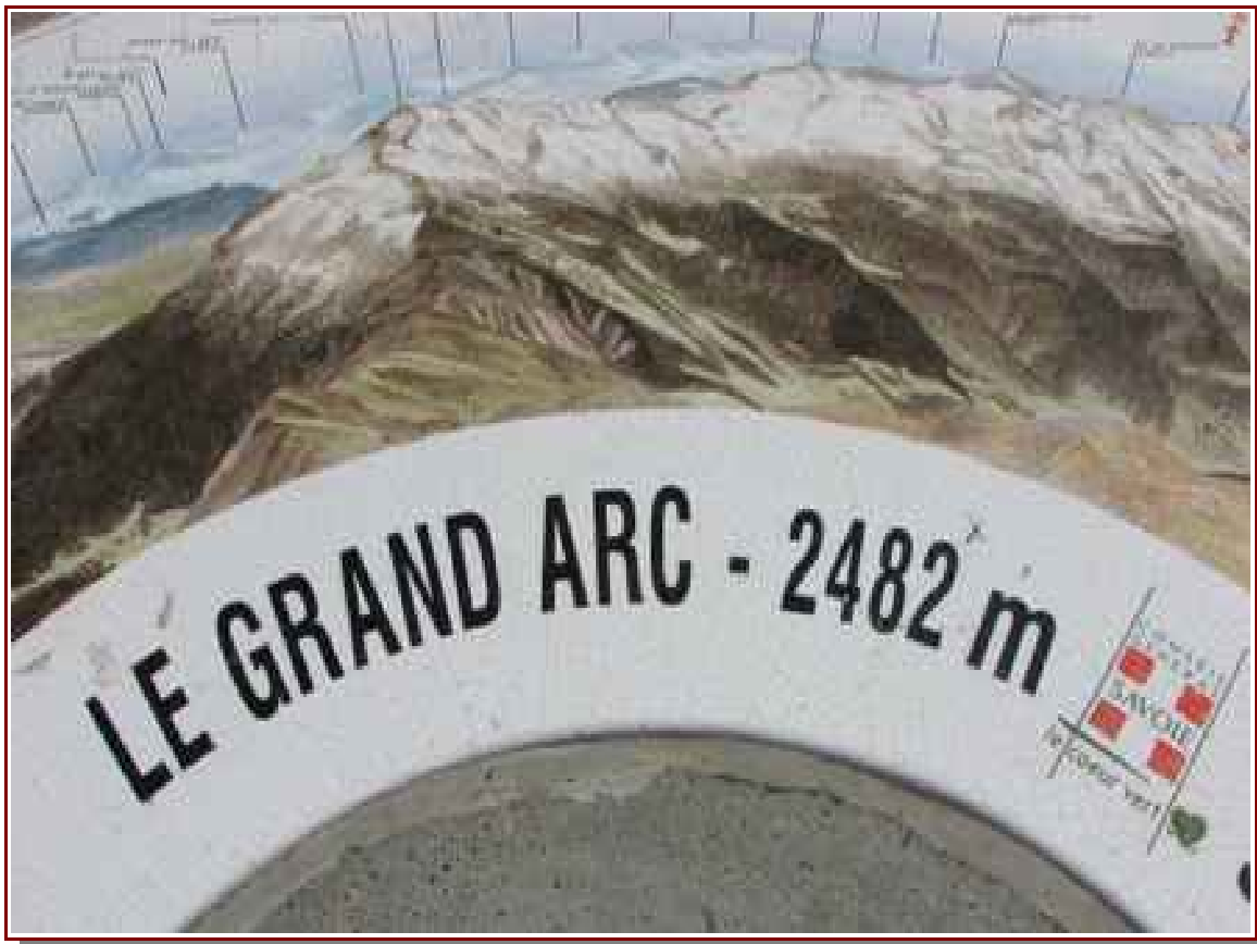
Table d'orientation au sommet

— Itinéraire de montée 3,5 km, 870 m de dénivelé positif.