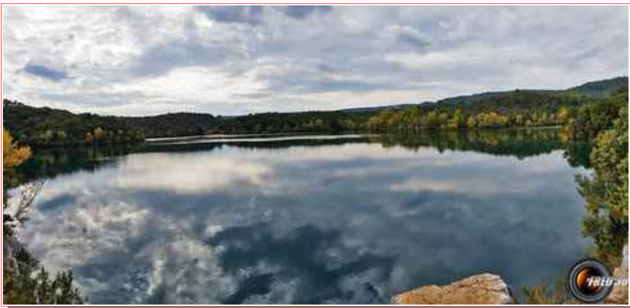
Le lac de Montpezat.