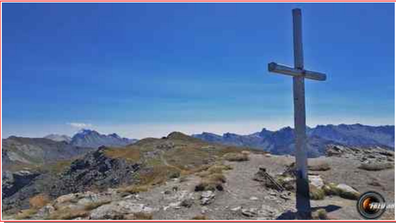
La croix de la Gardiole.