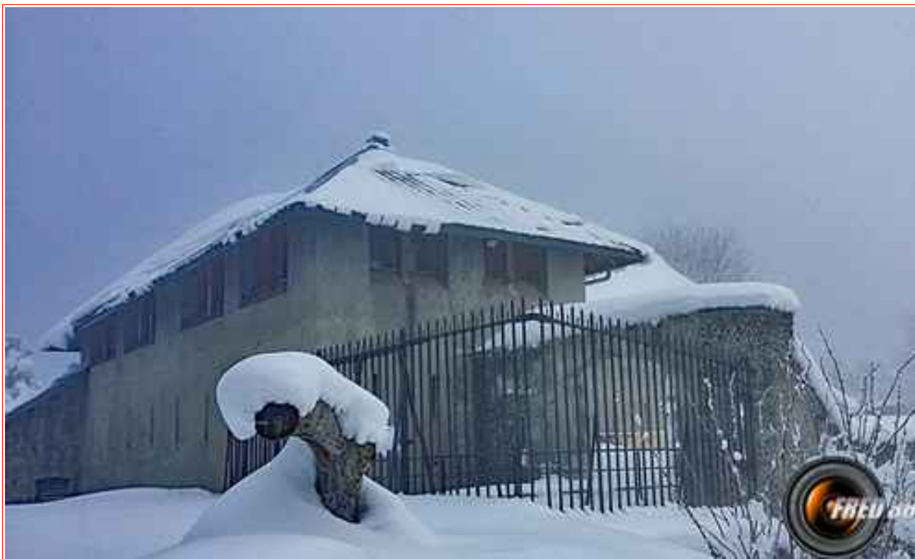
La batterie, et la fontaine devant.

— Itinéraire 3 km, pour 600 m de dénivelé positif.