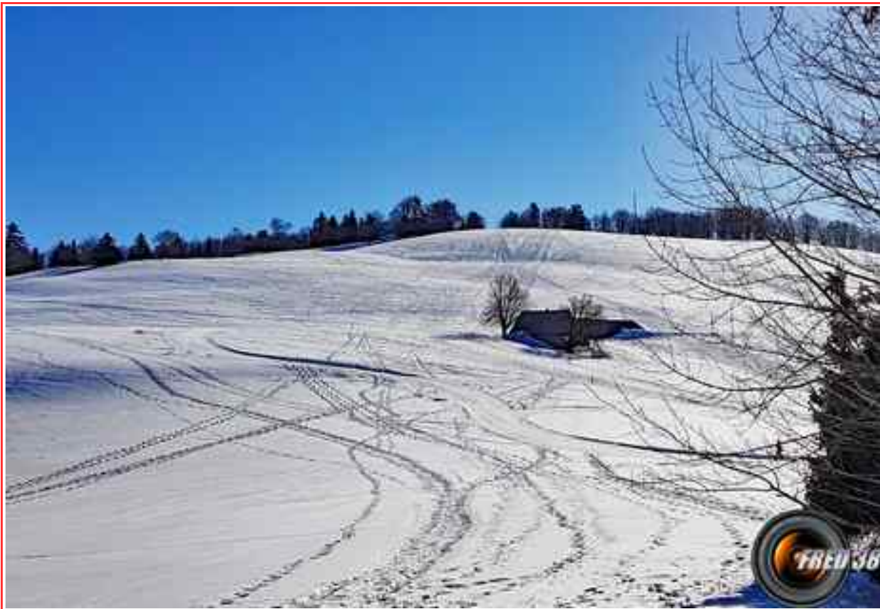
La Grande prairie de l'Emeindras de Dessus.