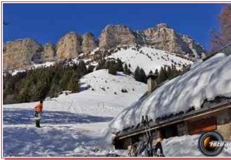
Habert de Chamechaude

HEBERGEMENT: Habert de Chamechaude. Cabane de Velouse.