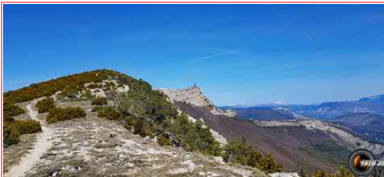
Les antennes du sommet.

Itinéraire 11km (A/R), 950 m de dénivelé positif.