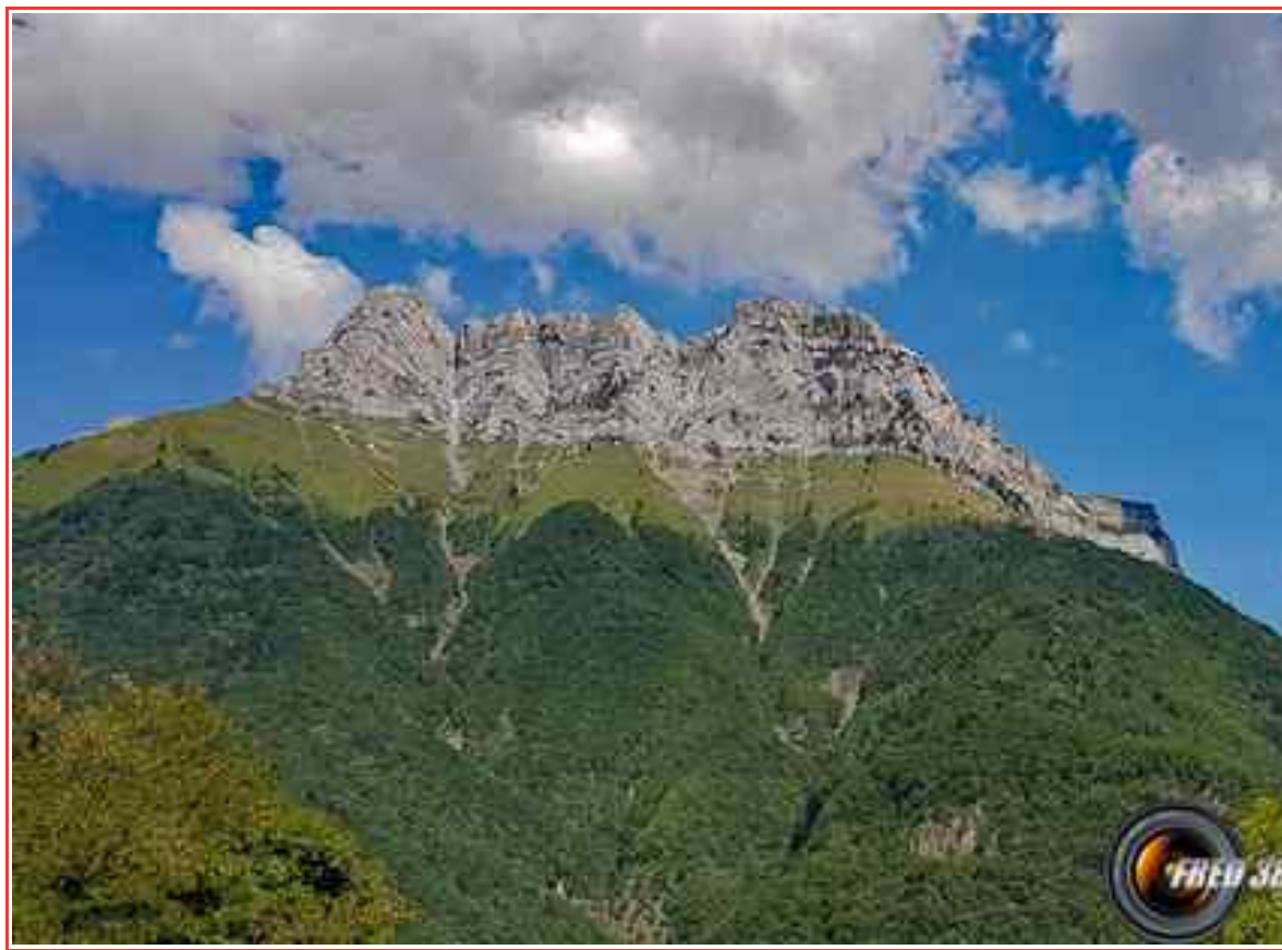
Le sommet vu de la route du col du Frêne