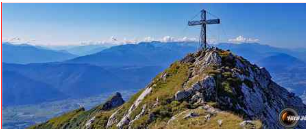
La croix du sommet

Longueur_ 13 km, 1121 m de dénivelé positif.