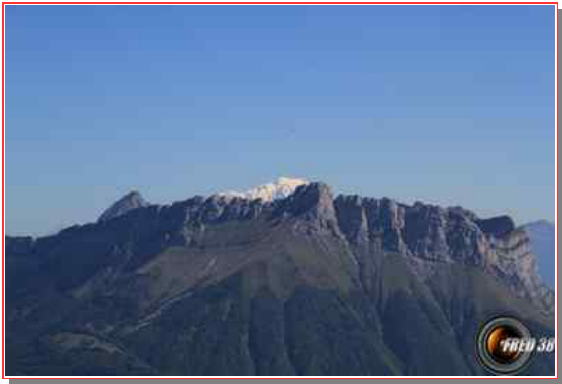
Le sommet vu de la pointe de la Galoppaz